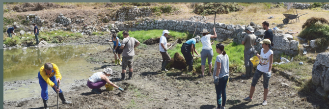
Volonterska akcija čišćenja lokve u Majkovima