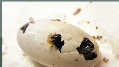
Izlijeganje mladunca riječne kornjače