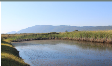
Lokva u Konavoskom polju